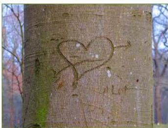
Op een bankje in het woud, stond geschreven in het hout, hoeveel ik van je hou...

Met Valentijnsdag geven geliefden elkaar extra aandacht. Blijft een liefdesverklaring, anoniem geschreven op een boom, daar eeuwig bewaard ? Wordt de liefdesdrift aangewakkerd door sommige kruiden uit het bos ? Welke planten wonen onder hetzelfde dak? Onder welke boom verklaar je je liefde het best ? Of welke boom plant je voor je uitverkorene ? Welke struik zorgt ervoor dat je hartje sneller gaat slaan ? Welke planten in het bos hebben zich onafscheidelijk aan elkaar gekoppeld ? In welke boom huist de godin Freya ? Zij die liefde en vruchtbaarheid schept ! Welke dieren krijgen kriebels vanaf Valentijnsdag ? Een liefdesdrankje maakt deze wandeling compleet ! (extra kostprijs, op aanvraag)